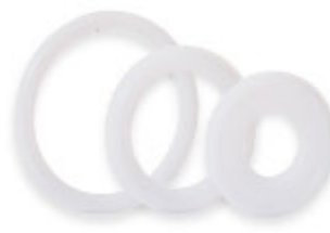
GYLON® BIO-PRO PLUS™