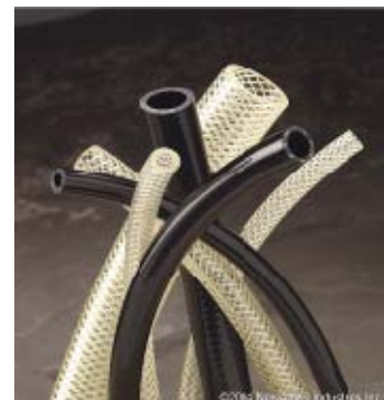
Urebrade – armerad polyuretanslang