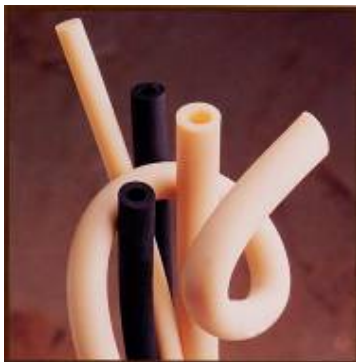
Suprene – termogummislang