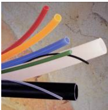
Nylotube – nylonslang