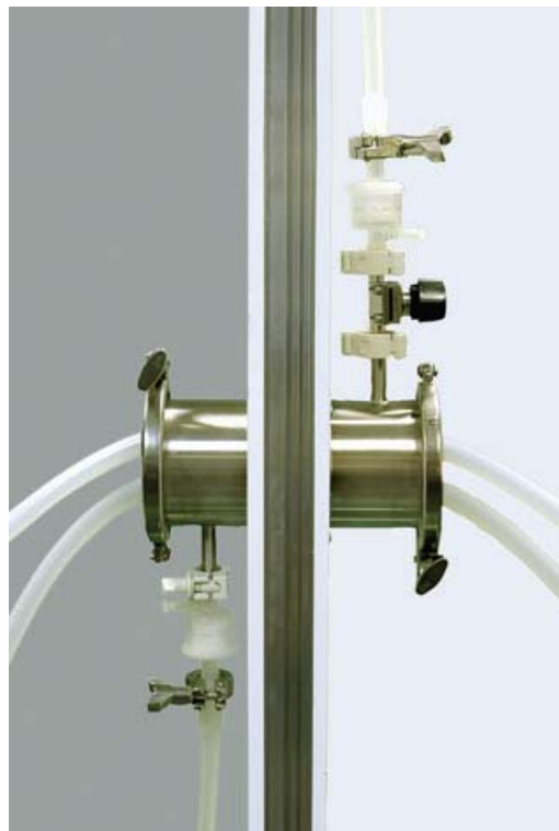
Här installerad med ventilering av filtrerad luft

Systemet kan spara tusentals kronor jämfört med andra genomförings-tekniker. Det Vid användning av "Single-Use" sparas också kostnader för sterilisering och validering jämfört med fasta rörsystem.