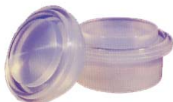
Proppar med inbyggd packning för Tri-Clamp anslutningar