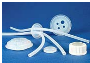
Opigmenterade proppar och genomföringar för flaskor med skruvlock