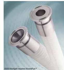
Wirearmerad slang, platinahärdad, USP klass VI