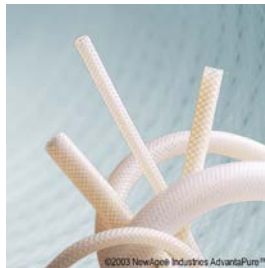
Vävarmerad slang, platinahärdad, USP klass VI