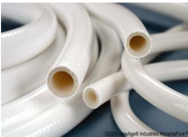
Dubbelarmerad slang, platinahärdad, USP klass VI