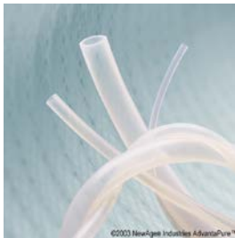
Oarmerad klar slang, platinahärdad, USP klass VI