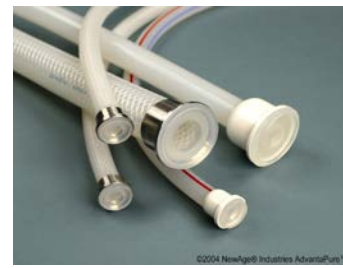
Gjutna TC anslutningar

Hose-Track™, ett unikt system som lagrar information om slangens lot.nummer, användning, sterilisering etc. för full kontroll och spårbarhet