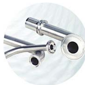
TC anslutning 90° böj (1/2", ¾", 1") För slang Id 1/2 - 1" (andra dim. på begäran)