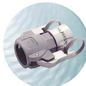
Camlock Hona (för Id 1/2" - 3") För slang Id 1/2 - 3"

Alla kopplingar är tillverkade av hög kvalitets 316L rostfritt stål. De flesta finns i storlekar från 1/4" till 4" innerdiameter. Sanitära kopplingar tillverkats med en finish på 20 Ra eller bättre, möter 3-A standard. Elektropolerade kan också erhållas med en finish på 15 Ra eller bättre.