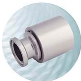
Mini-TC anslutning För slang Id 1/4", 3/8", 1/2", 5/8" och 3/4"