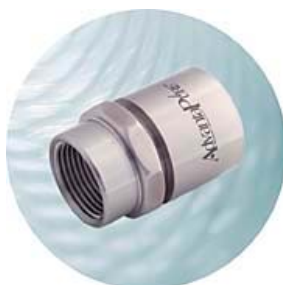
NPT anslutning Hona (för Id 1/4" - 4") För slang Id 1/4 - 4"