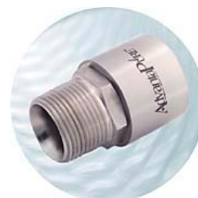
NPT anslutning Hane (för Id 1/4" - 4") För slang Id 1/4 - 4"