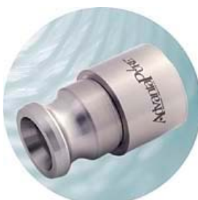
Camlock Hane (för Id 1/2" - 3") För slang Id 1/2 - 3"