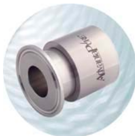
TC anslutning (1", 1½", 2", 2½", 3", 4") För slang Id 1/4 - 4"