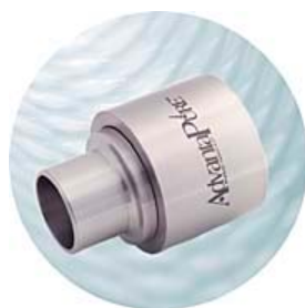
Svetsanslutning (för Id 1/4" - 4") För slang Id 1/4 - 4"