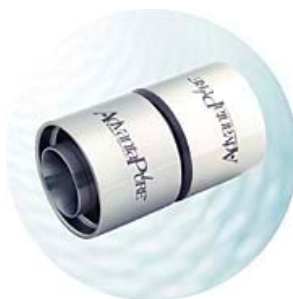
Slangförlängning (för Id 1/2" - 4") För slang Id 1/2 - 4"